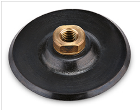
Zur sicheren Befestigung der Klett-Diamantscheiben. M 14-Anschluss.