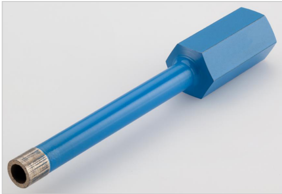
M 14, nass, für Naturstein und Feinsteinfliesen.