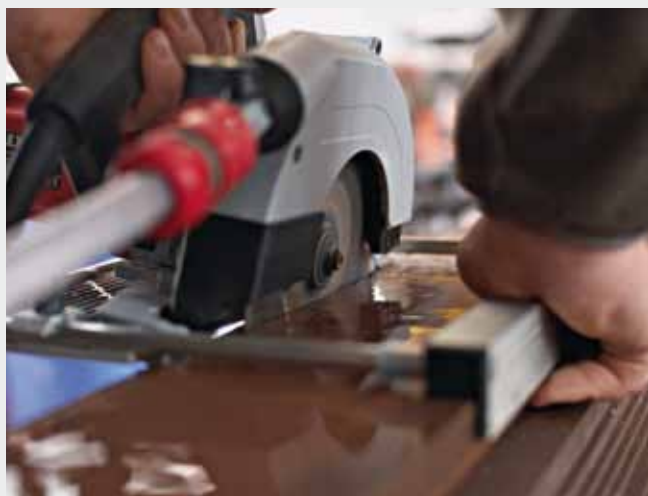
Im Gegensatz zu schweren stationären Maschinen überzeugt die CS 60 WET durch einfaches Handling.