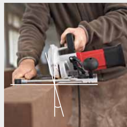
Durch den präzisen und wechselseitig montierbaren Parallelanschlag kann mit der CS 60 WET auch ein negativer Gehrungsschnitt durchgeführt werden.