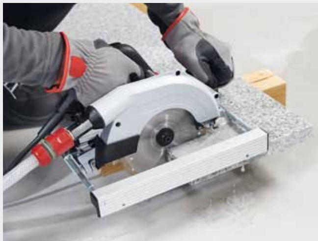
Die extrem robuste und zuverlässige CS 60 WET ist ideal für die Bearbeitung von Fensterbänken, Arbeitsplatten, Fassadenplatten, Terrazzoplatten im Garten- und Landschaftsbau sowie für die Fugensanierung im Fußbodenbereich.