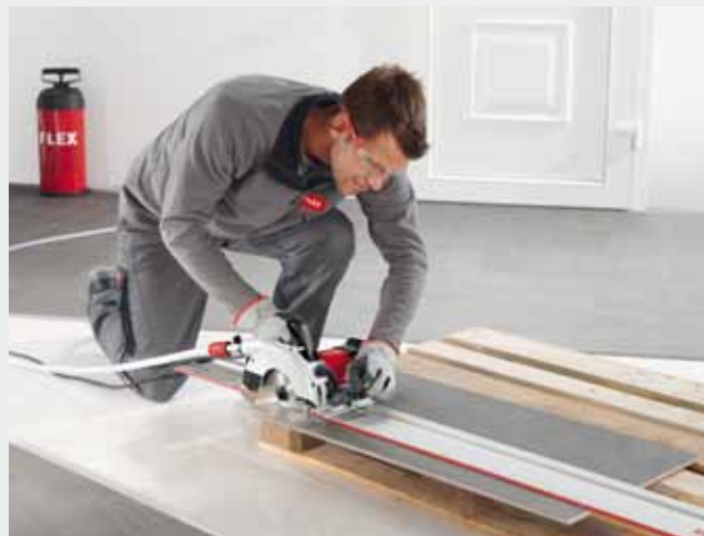
Lange Schnitte lassen sich mit der CS 60 WET und der passenden Führungsschiene exakt ausführen.