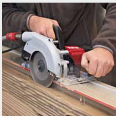
Die CS 60 WET eignet sich, in Verbindung mit der Führungsschiene, ideal zum Einbringen von Wassernasen bzw. Wasserrinnen in Fensterbänke oder Mauerkronen.