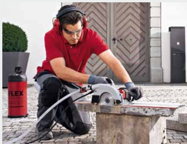
Maximale Flexibilität. Wenn kein direkter Wasseranschluss zur Verfügung steht, ist der FLEX Wasserdruckbehälter WD 10 die ideale Ergänzung.