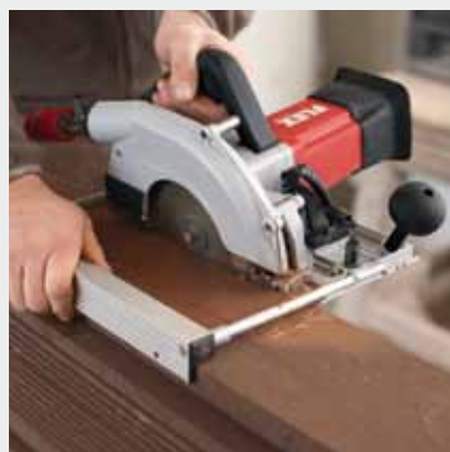
Mit dem im Lieferumfang enthaltenen Parallelanschlag können, auch ohne Hilfe einer Führungsschiene, exakte Schnitte durchgeführt werden.